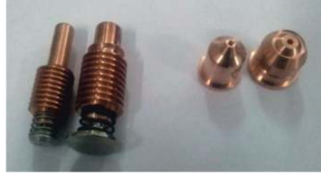
Powermax 105 - 125 sarf malzemeleri karşılaştırma Powermax 105 vs 125 consumables comparison